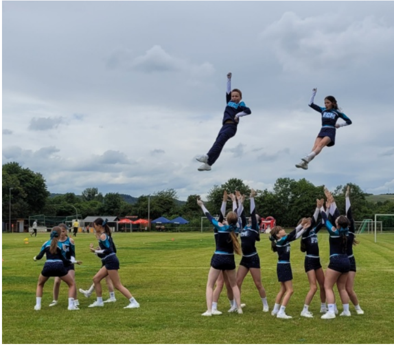
FCM Spirit Elite